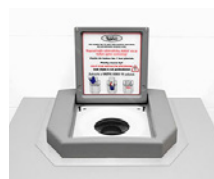
Marco de acero inox.