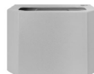
Depósito de agua