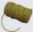
Cuerda de poliéster